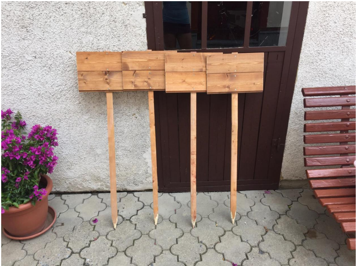
(obr. č. 1 - tabulky na vzkazy)