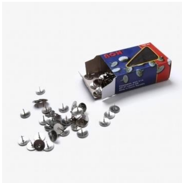
(obr. č. 2 – připínáčky)